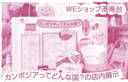
カンボジアってどんな国?の店内掲示