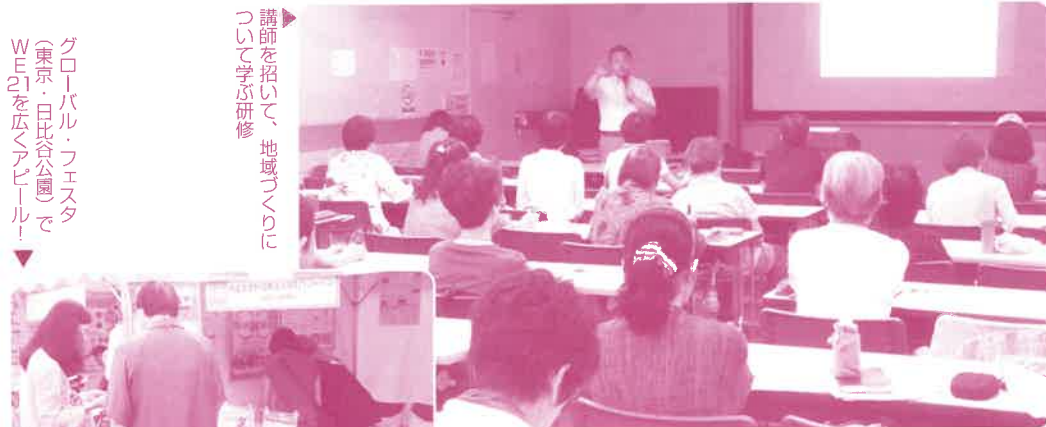
講師を招いて、地域へくわついで字が研修