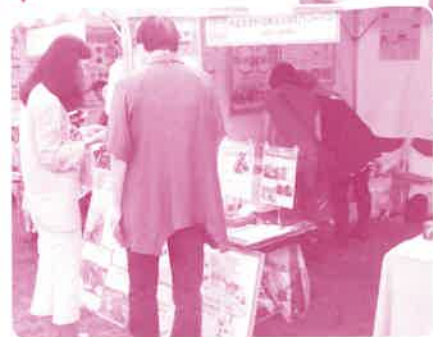
グローバル・フェスタ (東京・日比谷公園)で WE21を広くアピール！

このほか、市民とともに社会問題について考える場づくりとして開催している、講座やシンポジウムでも一般市民の参加が増えています。こうした変化には、ホームページのリニューアルやfacebookなどを活用した情報公開と発信も貢献していると思えます。