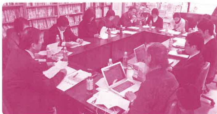
中間支援組織が集まったネットワーク会議

きな反響がありました。活動主体となる「共通の目標や価値観にもとづく自主的なグループや団体」の多くが、NPO（民間非営利組織）システムによつて法的根拠をもち、税制上の優遇が得られる法人格をもつていたのです。その後十数回の訪米調査によつて、「NPO」をつくること、「情報ネットワーク」と非営利・独立（NPO型）の「シンクタンク」を実現することが市民社会を強くすることだ、と確信しました。