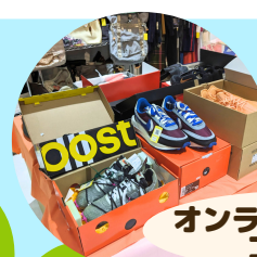
オンラインショップ コーナー