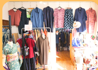
▲WEショップ相模原若松店のリ メイクコーナー「スペースWEWE」