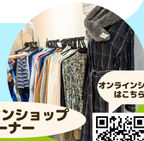
オンラインショップ はこちら!