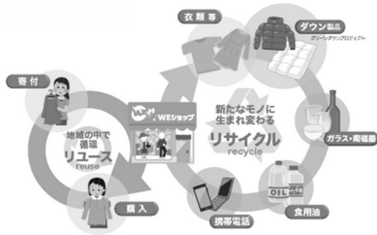
▲WEショップを中心とした資源循環のしくみ

全国のご家庭・企業からご寄付いただいた衣類・カバン・アクセサリー・靴、生活雑貨など… WEバザールでリユースのお買い物をお楽しみください！